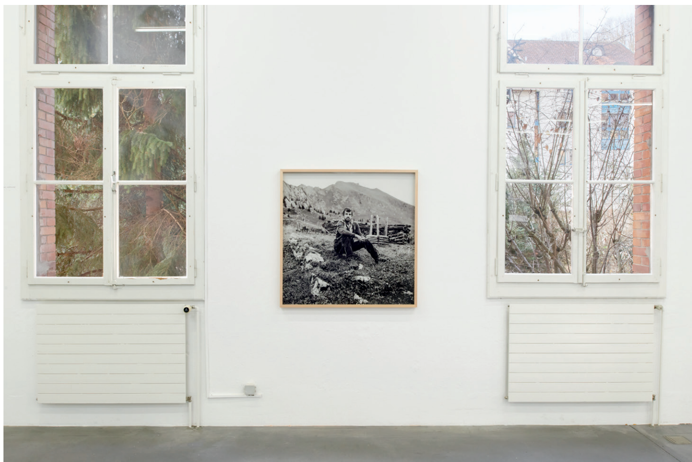
Vue d'exposition, Thomas Kern, je te regarde et tu dis , Fri Art, 2020.

Im Jahr 1996 rief der Staatsrat auf Vorschlag der Direktion für Erziehung, Kultur und Sport die "Fotografische Ermittlung: Thema Freiburg" ins Leben. Seither beauftragt der Kanton alle zwei Jahre eine Fotografin oder einen Fotografen mit einer Fotoreportage. Das Thema oder der Gegenstand der Reportage muss einen Bezug zum Kanton Freiburg haben (Ort, Ereignis, Persönlichkeit usw.) und bei der Einreichung des Projekts noch unveröffentlicht sein. Die Preisträgerin oder der Preisträger erhält für die Realisierung des Projekts. Diese Initiative dient der Förderung des fotografischen Schaffens und zugleich dem schrittweisen Aufbau einer zeitgenössischen Fotosammlung zum Kanton. Die nächste Ausgabe der "Fotografischen Ermittlung: Thema Freiburg" wird 2021/22 stattfinden; sie wird im ersten Quartal von 2021 ausgeschrieben.