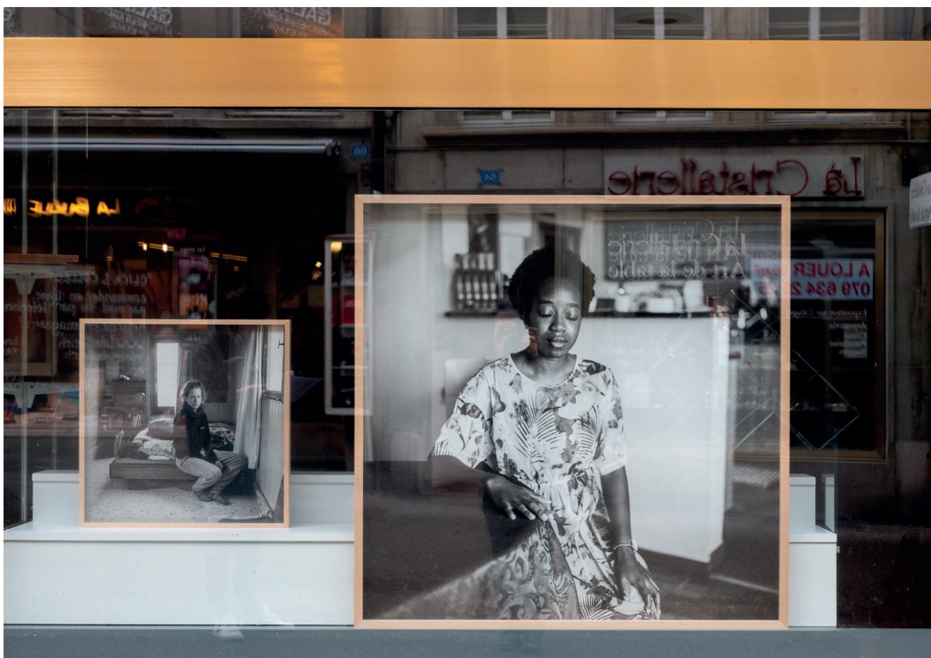
Vue d'exposition, Thomas Kern, je te regarde et tu dis , Fri Art, 2020.

Während des ganzen Monats Februar schenkt Fri Art der Ausstellung von Thomas Kern ein zweites Leben, je te regarde et tu dis .