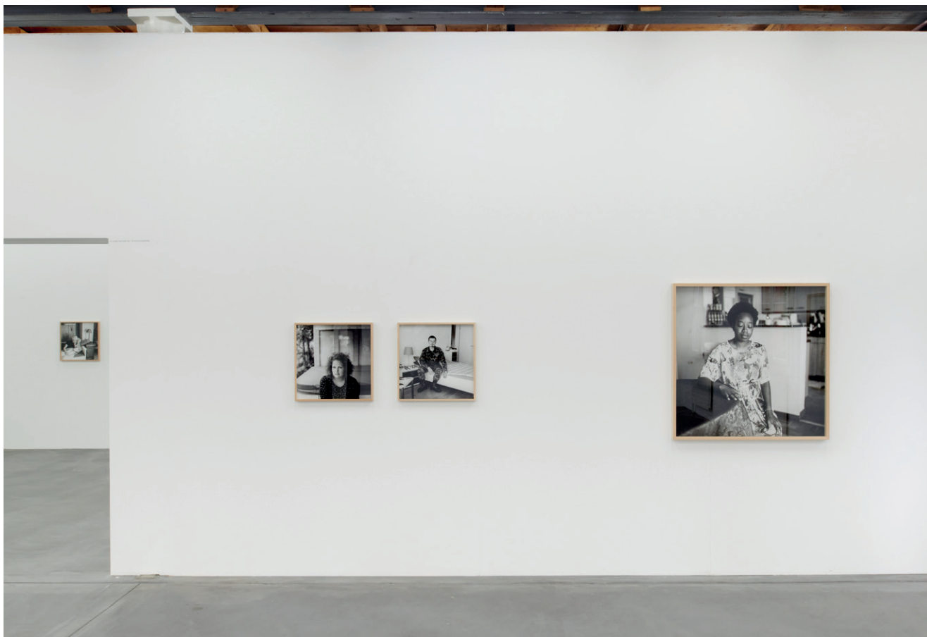
Vue d'exposition, Thomas Kern, je te regarde et tu dis , Fri Art, 2020.

Durant tout le mois de février, Fri Art donne une seconde vie à l'exposition de Thomas Kern, je te regarde et tu dis .