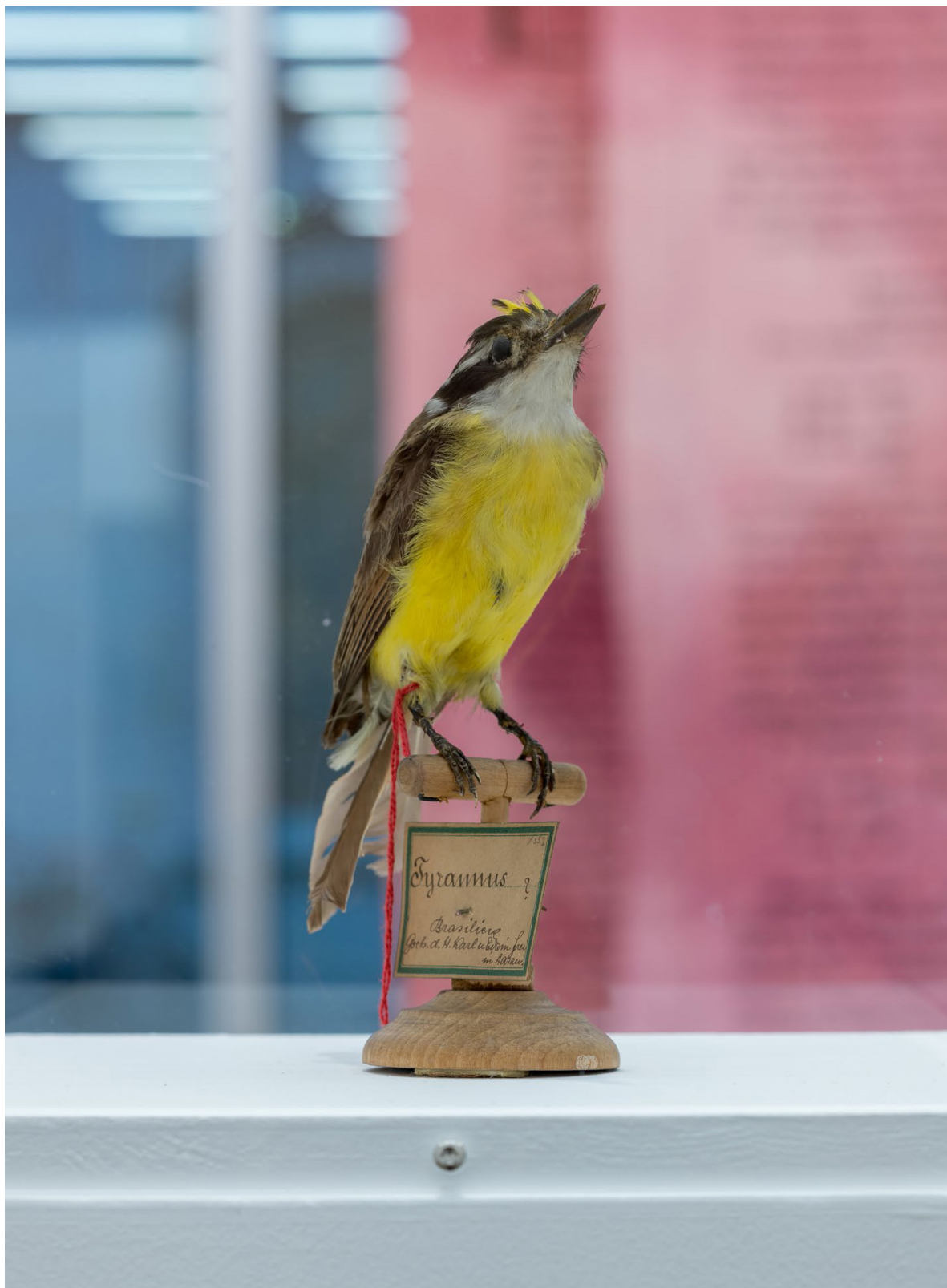
Denise Bertschi, Haunting Home , 2020