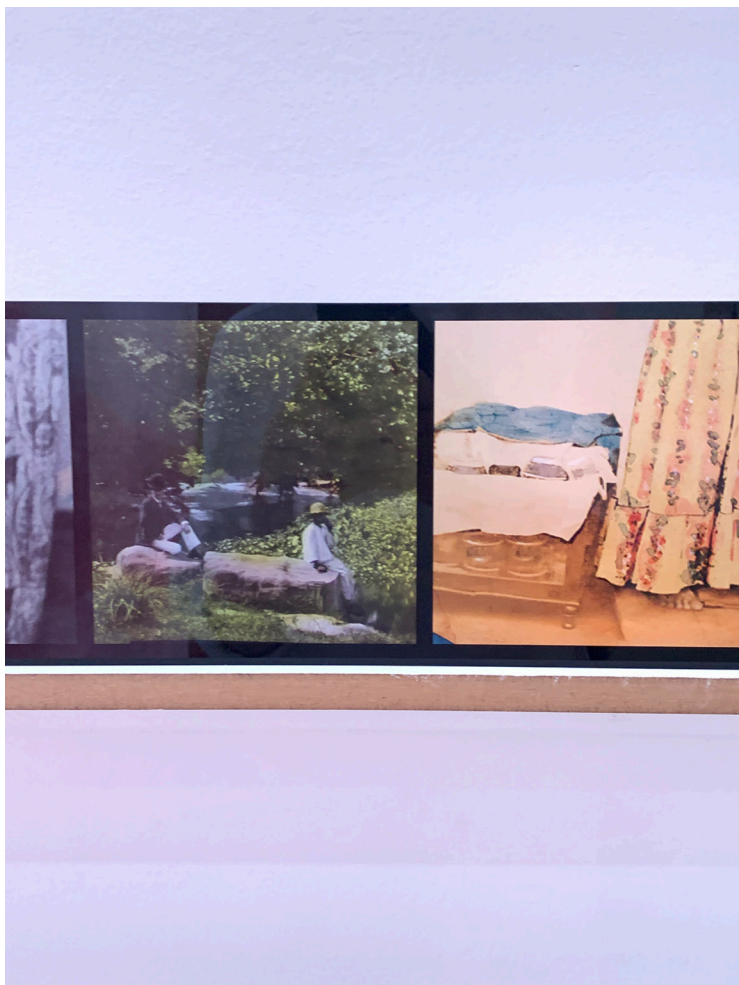
Denise Bertschi, Haunting Home , 2020