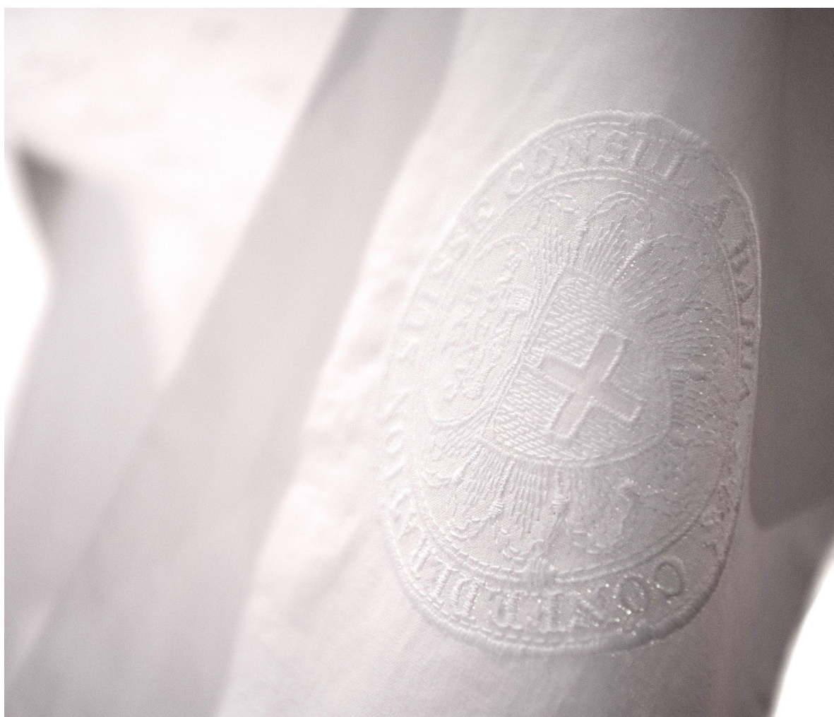
Denise Bertschi, HELVÉCIA, Brazil , 2017, broderie en trous, vue d'exposition au MKG Hamburg, 2018