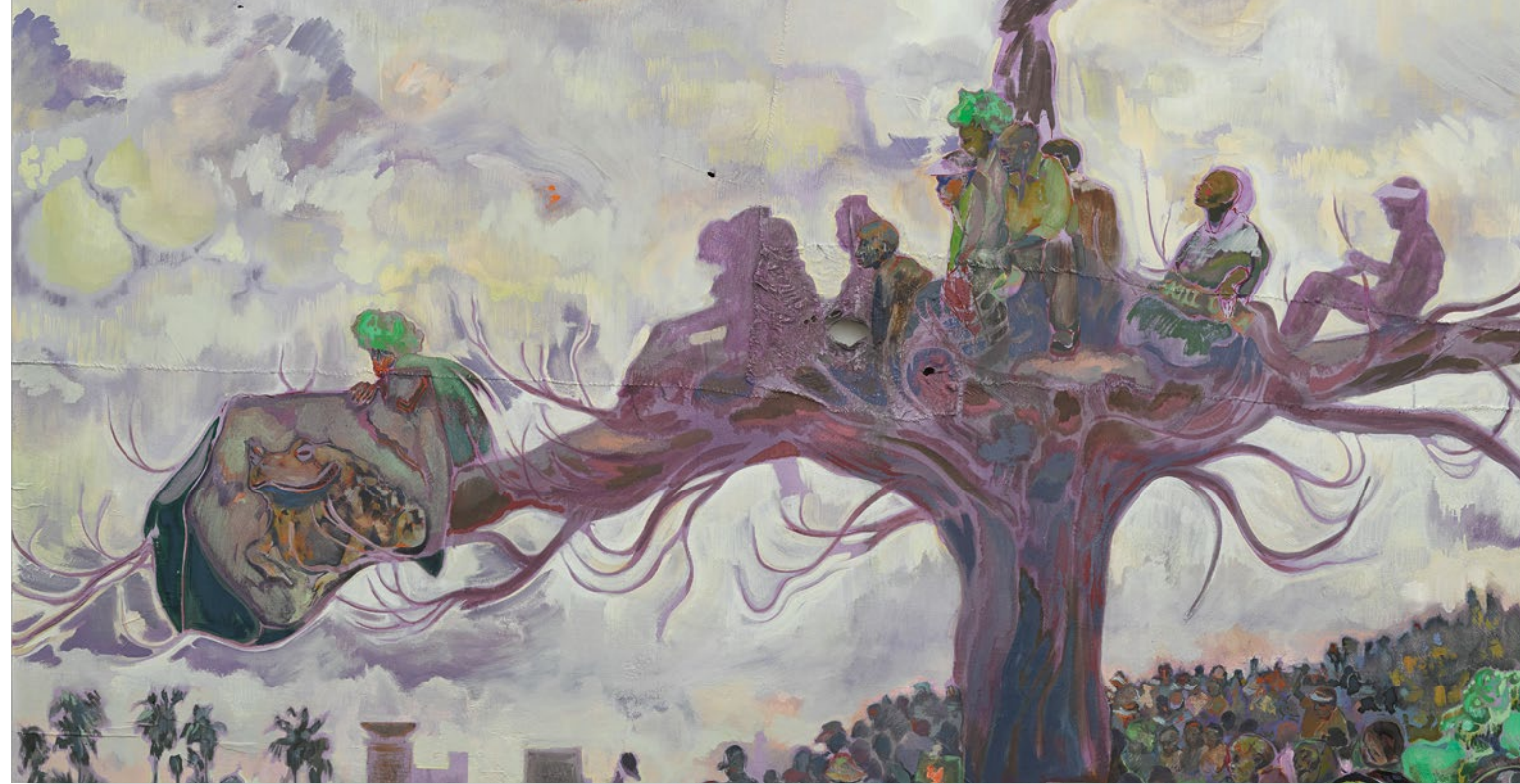
Michael Armitage The Fourth Estate , 2017 Detail Courtesy of the artist and The Joyner / Giuffrida Collection © Michael Armitage

Pathos and the twilight of the idle ist der Titel eines Werks von 2019. Es ist ein hochformatiges Gemälde von beträchtlichen Maßen. In der Mitte des Bildes befindet sich eine Figur, die auf die Betrachtenden zuschreitet. Ihre Mimik und die hochgezogenen Schultern vermitteln die Bereitschaft zu Anklage und Kampf. Vor ihrem Körper hängen zwei Dosen mit Tränengas. In den Händen, die sich merkwürdig vervielfacht haben, hält sie sandfarbene Schleudern. Im Hintergrund quellen unzählige Farben. Das Bild entstand nach einer Kundgebung der größten kenianischen Oppositionspartei 2017 in Nairobi. Einige der abgebildeten Demonstrant*innen sind grotesk verkleidet, tragen Kostüme, Perücken oder Kronen. Eine Person schwingt eine Fahne. Die muskulöse Figur in der Mitte trägt ein helles Bikini-Top.