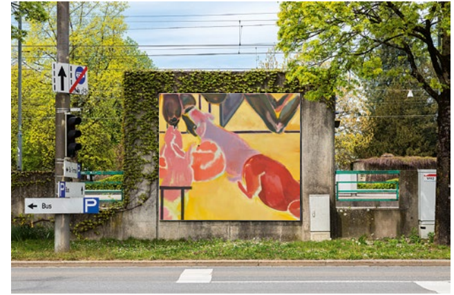
Foto: Ollie Hammick Courtesy of the artist and Christen Sveaas Art Collection © Michael Armitage

Michael Armitage Mother's Milk , 2022 Detail