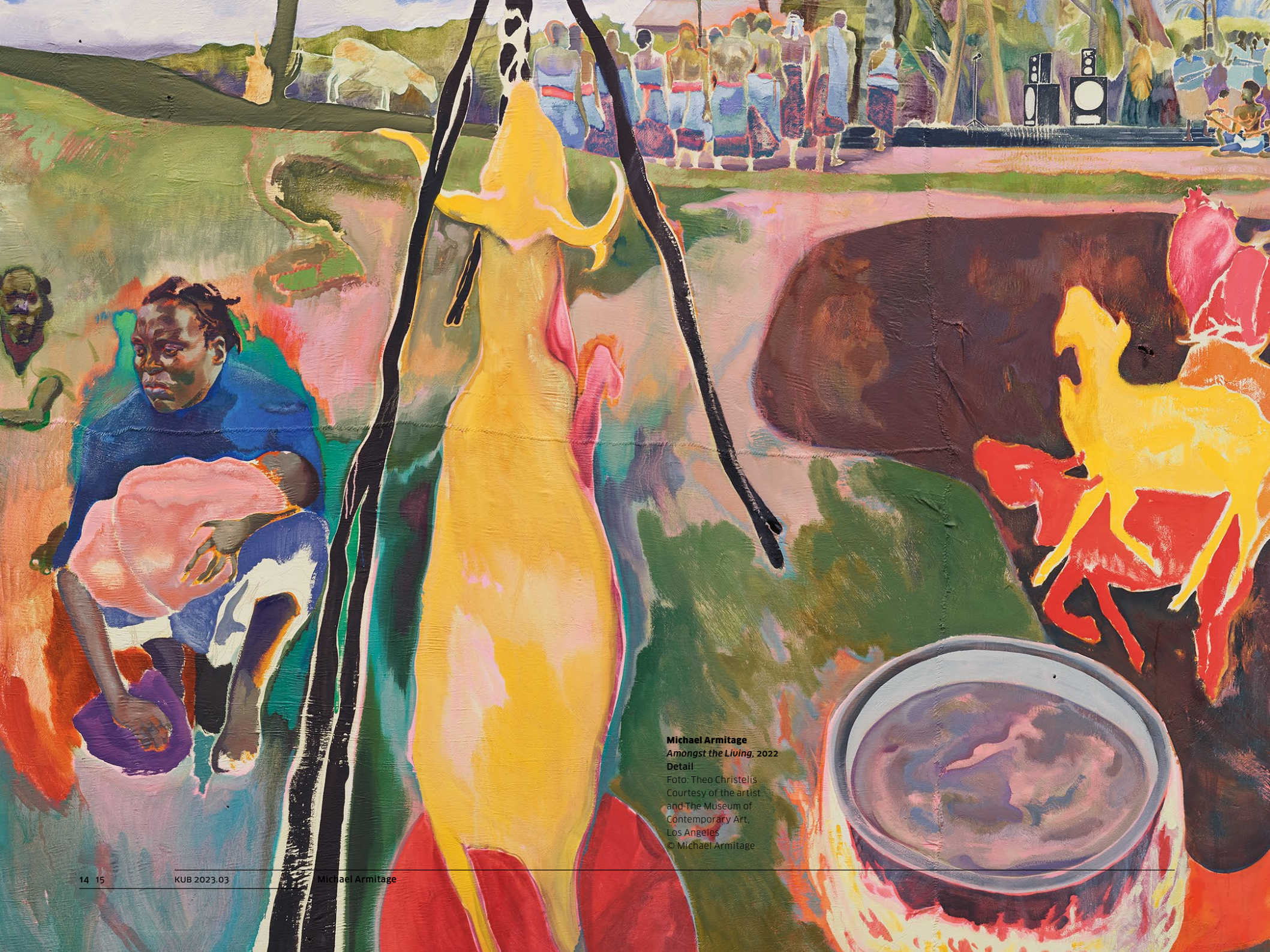
Michael Armitage Amongst the Living , 2022 Detail Foto: Theo Christelis Courtesy of the artist and The Museum of Contemporary Art, Los Angeles © Michael Armitage